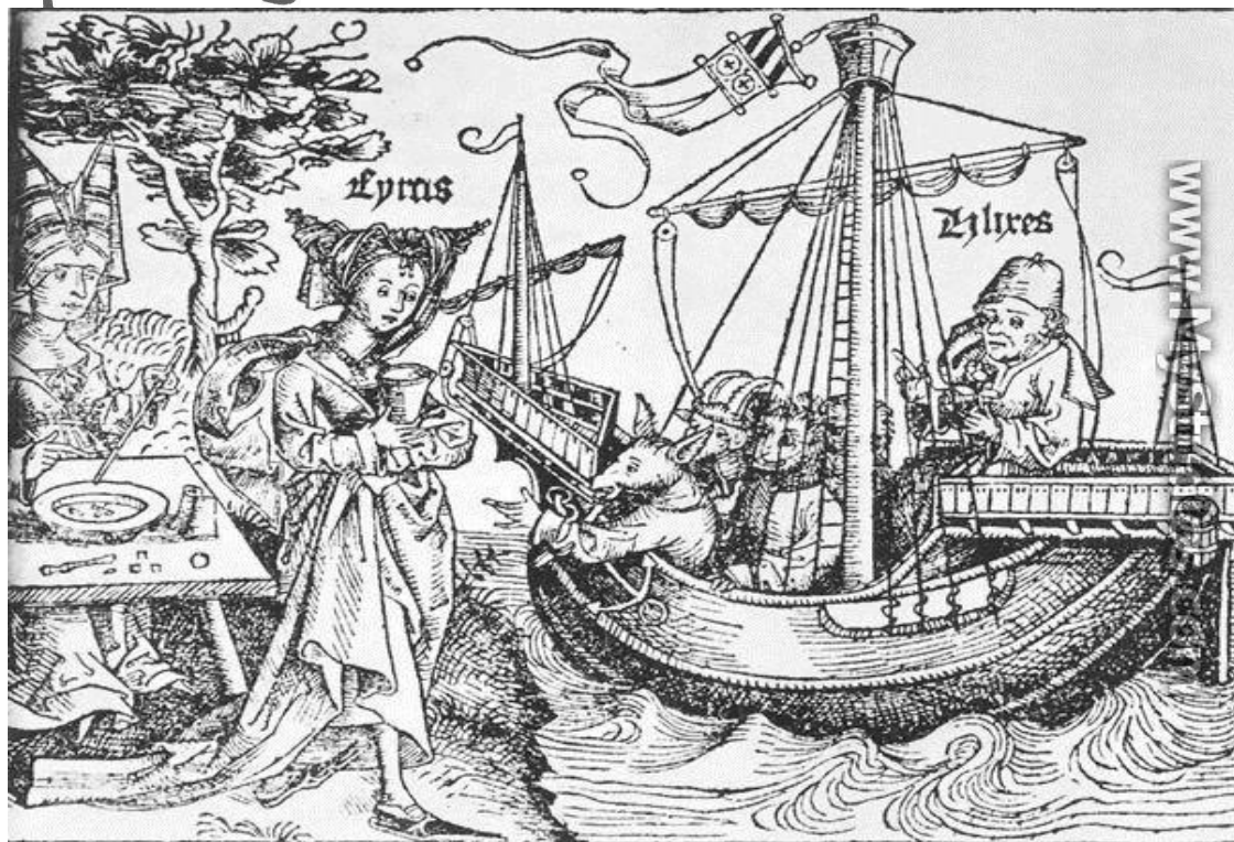
Michael Wolgemut (1434-1519): Circe a Odysseus