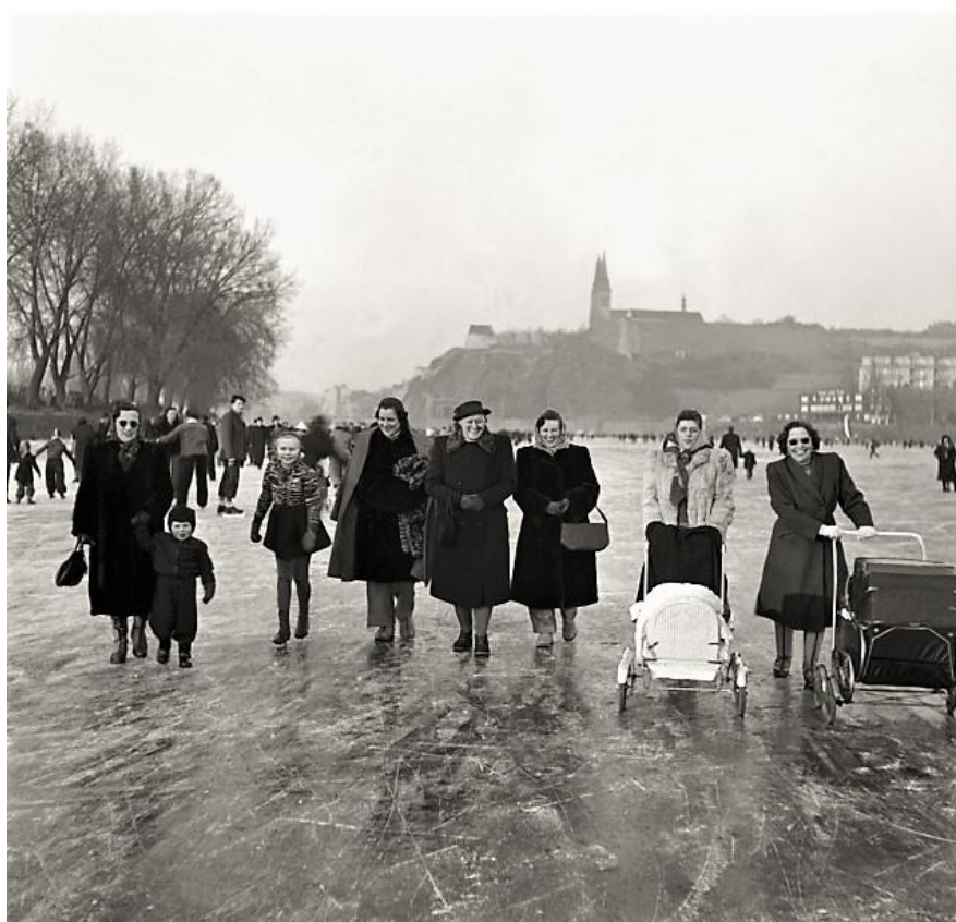
Pegas, v kočárku vlevo.