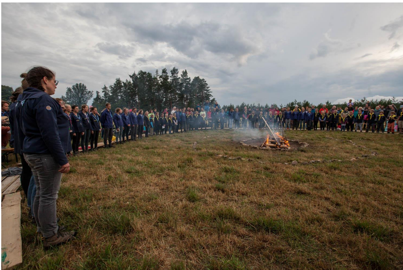
Červená se line záře....