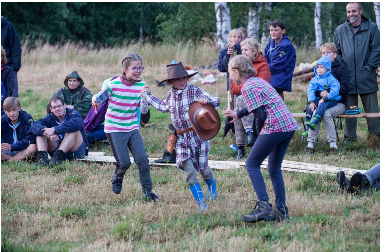
Několik fotografií táborákových výstupů